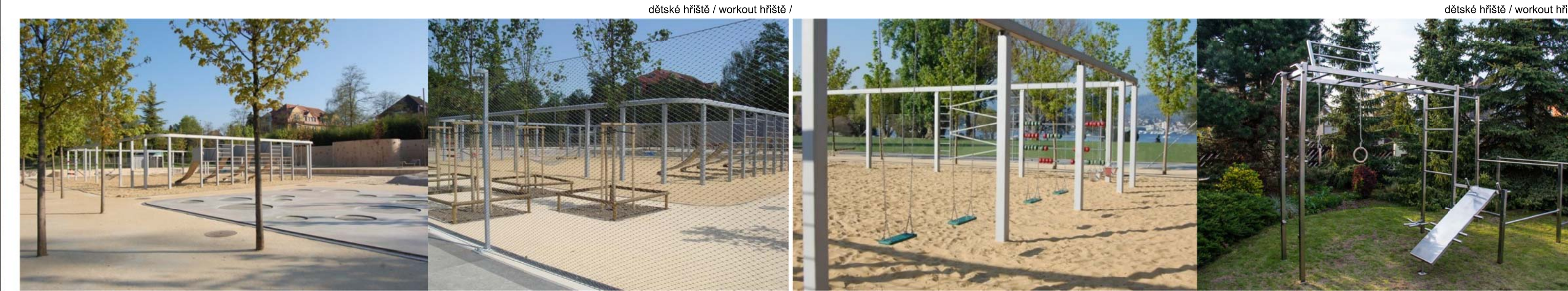
dětské hřiště / workout hřiště /