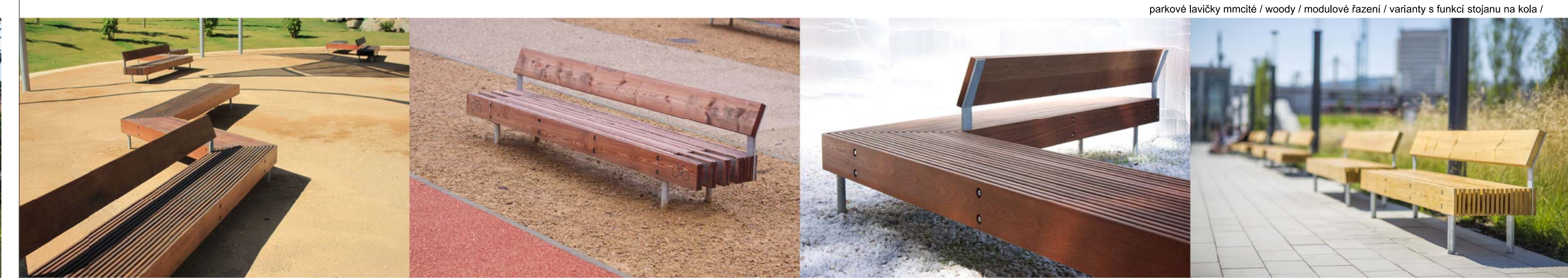
parkové lavičky mmcíté / woody / modulové řazení / varianty s funkcí stojanu na kola /