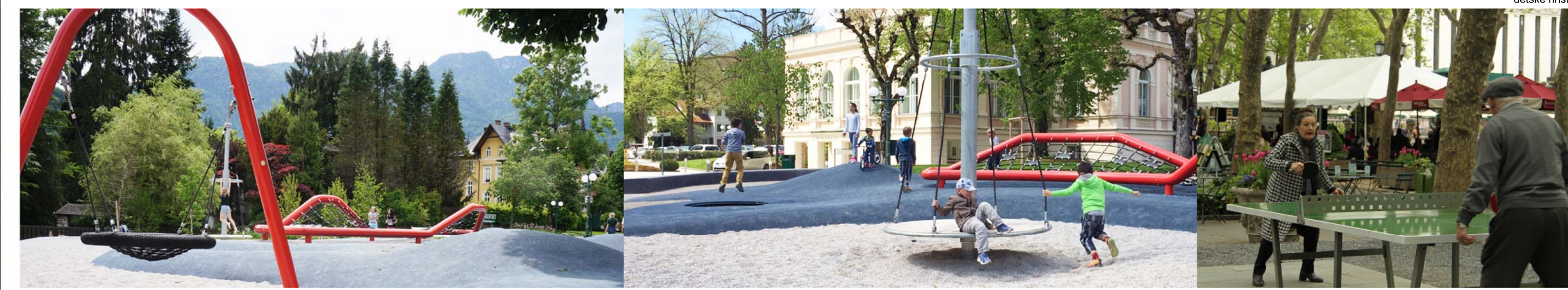
dětské hřiště /