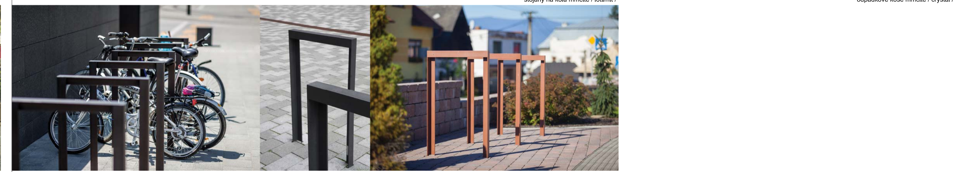
stojany na kola mmcíté / lotilmit /