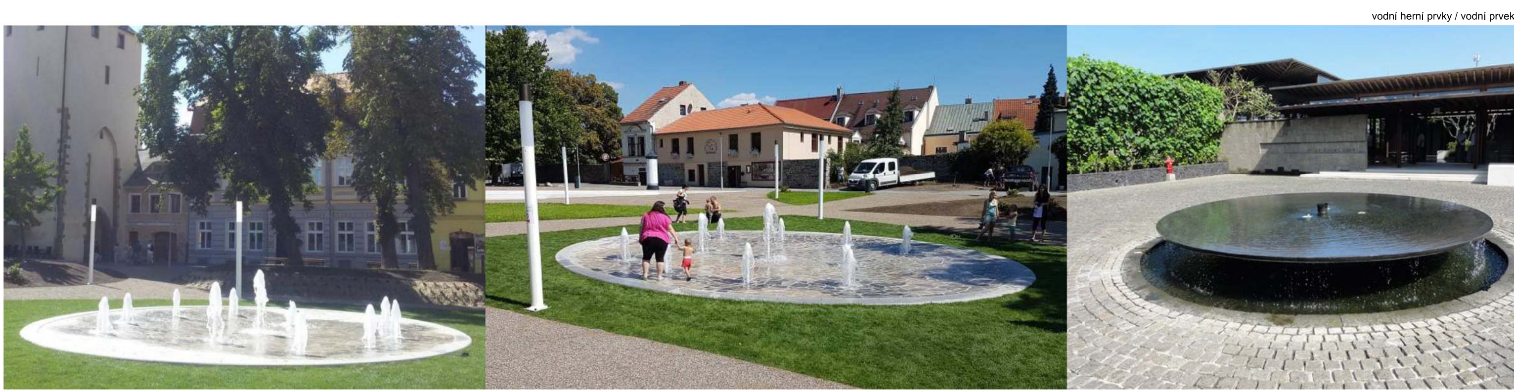
vodní herní prvky / vodní prvek