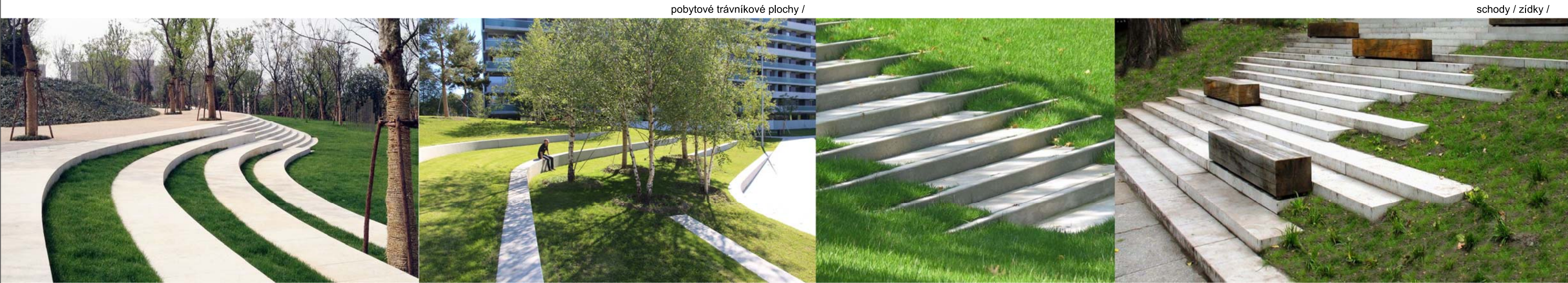
pobytové trávníkové plochy /