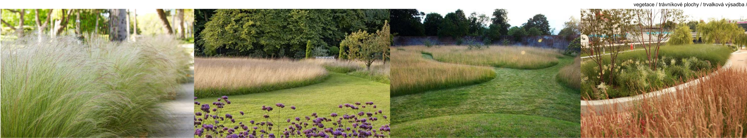
vegetace / trávníkové plochy / trvalková výsadba /